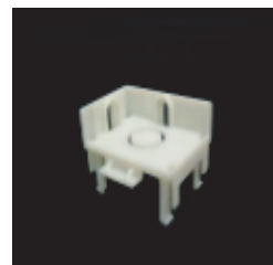
サイドキャップ 金型：