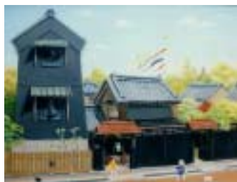
有形文化財指定のアートギャラリー

供給側と需要側双方で、このような事態に備えて「保証基金」等を設立して万が一に備えるなど今後の業界のシステム向上に期待したい。