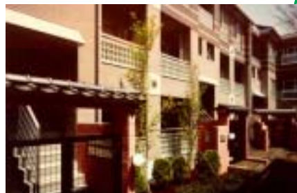
モダンなデザインの賃貸物件